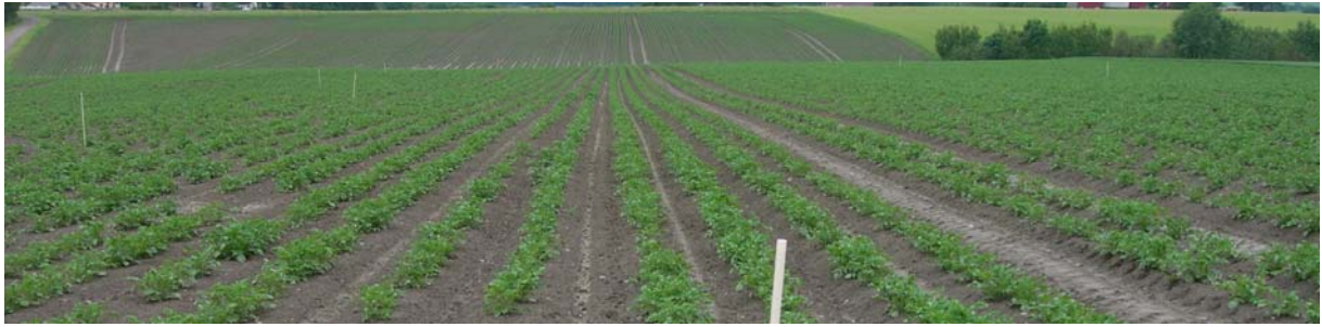
27. juni Innovator: FLEX til venstre og TRAD til høyre for pinnen midt i bildet. Ingen synlige forskjeller.