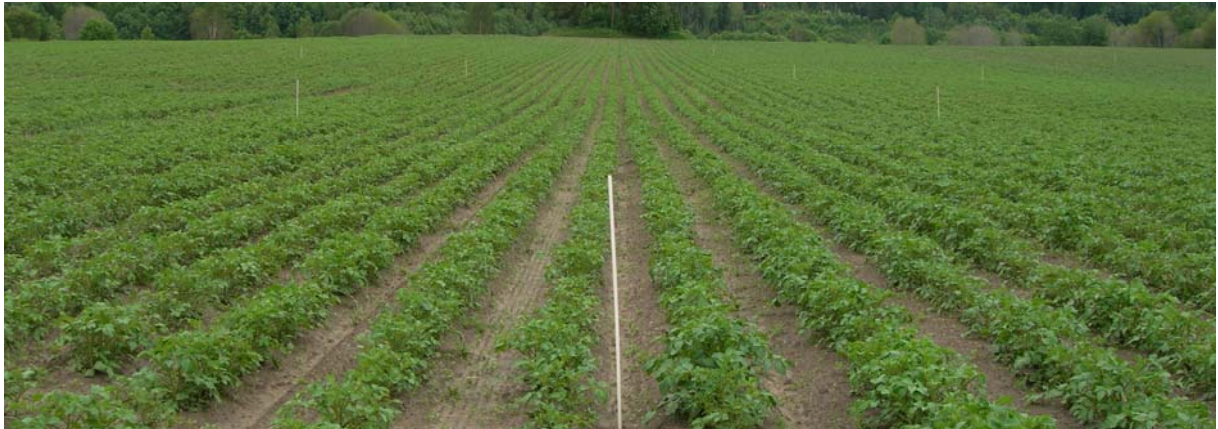
26. juni (Uke 26) Asterix: TRAD til venstre og FLEX til høyre for pinnen midt i bildet. Ingen synlig forskjell.