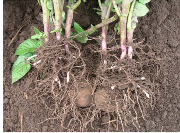
26. juni Redstar: Rot, stolon og knollutvikling hos TRAD til venstre og FLEX til høyre.