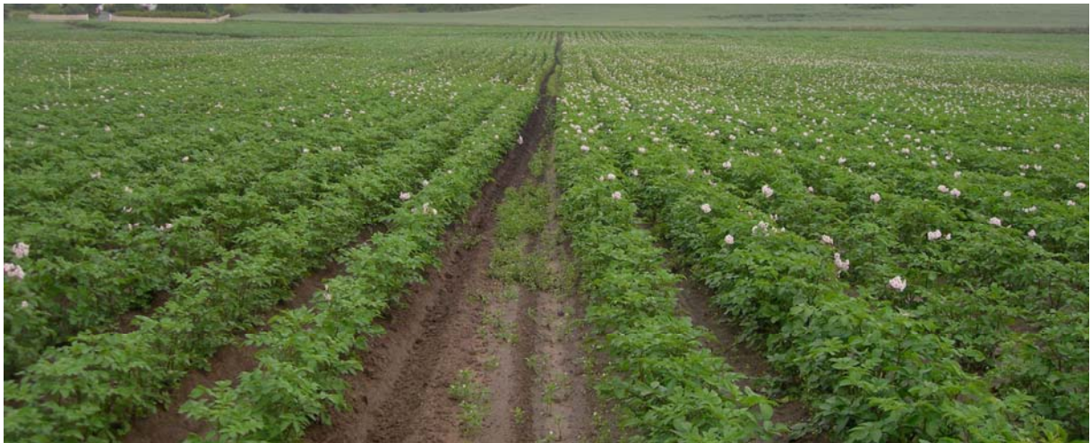
18. juli (Uke 29) Redstar: TRAD til venstre og FLEX til høyre i bildet. Ingen større synlige forskjeller.