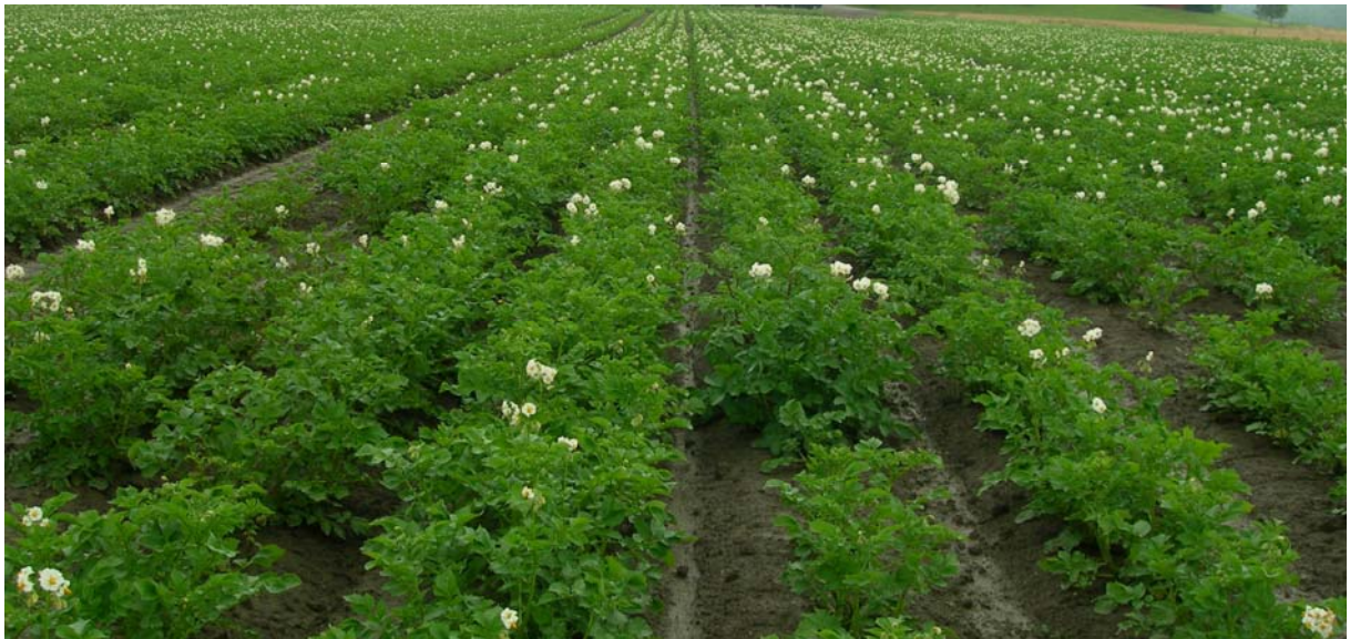
13. juli Innovator: TRAD til venstre og FLEX til høyre i bildet. Svakt frodigere planter i TRAD.