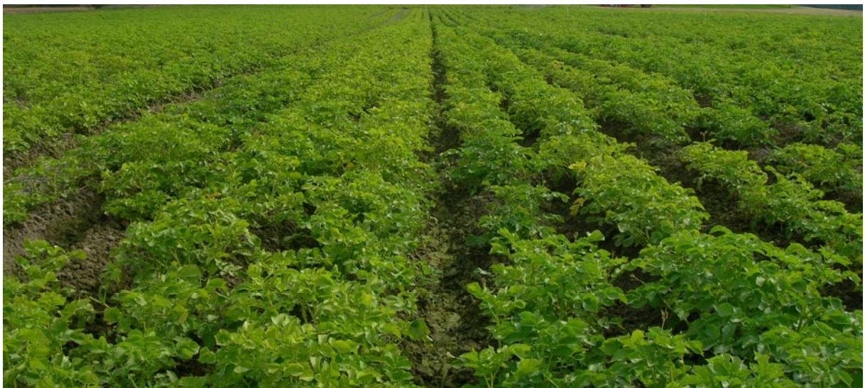
7. august Innovator: TRAD til venstre og FLEX til høyre i bildet. Lysere farge i TRAD (svovelmangel).