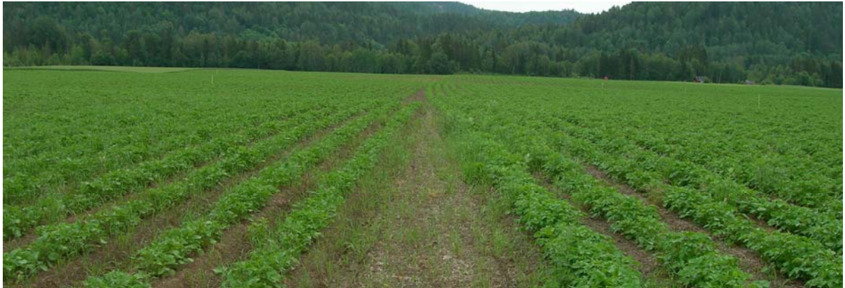
26. juni (Uke 26) Beate: TRAD til venstre og FLEX til høyre i bildet. Frodigere vekst i FLEX.