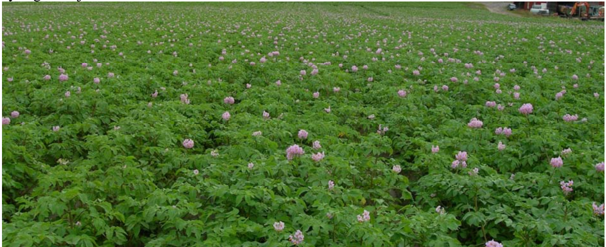
18. juli (Uke 29) Asterix: FLEX til venstre og TRAD til høyre i bildet. Ingen synlig forskjell.