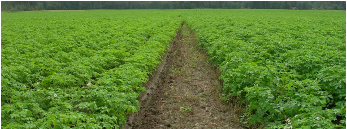
18. juli (Uke 29) Beate: TRAD til venstre og FLEX til høyre i bildet. Mørkere farge i FLEX.