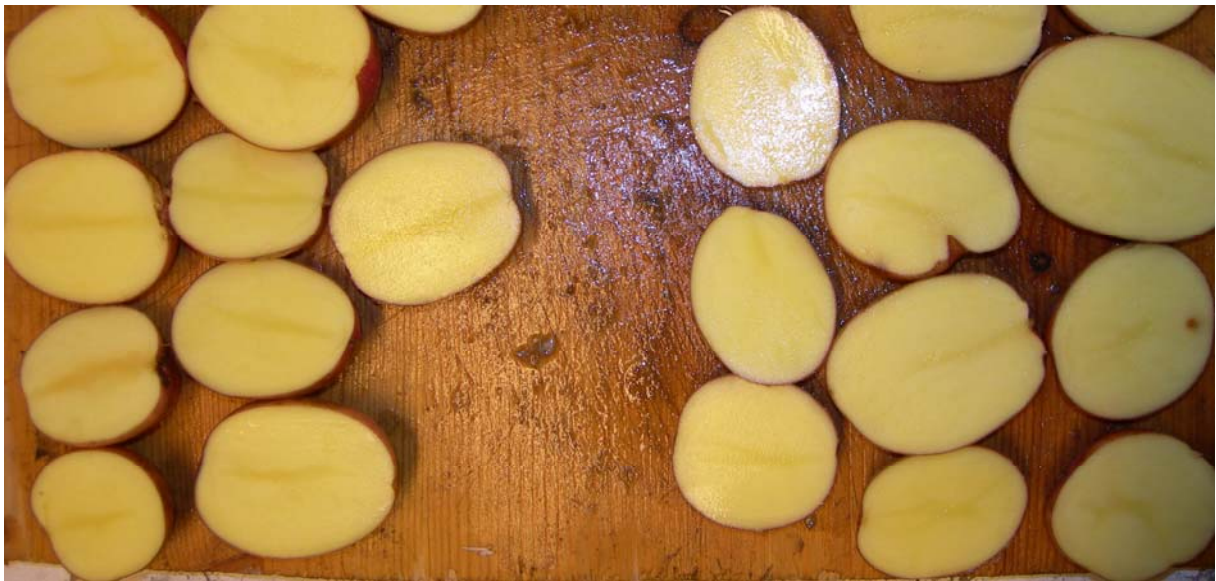
Gjennomskjæring av knoller av Redstar. Gruppering av knoller med noe fargeforskjell til venstre og lite fargeforskjell til høyre.