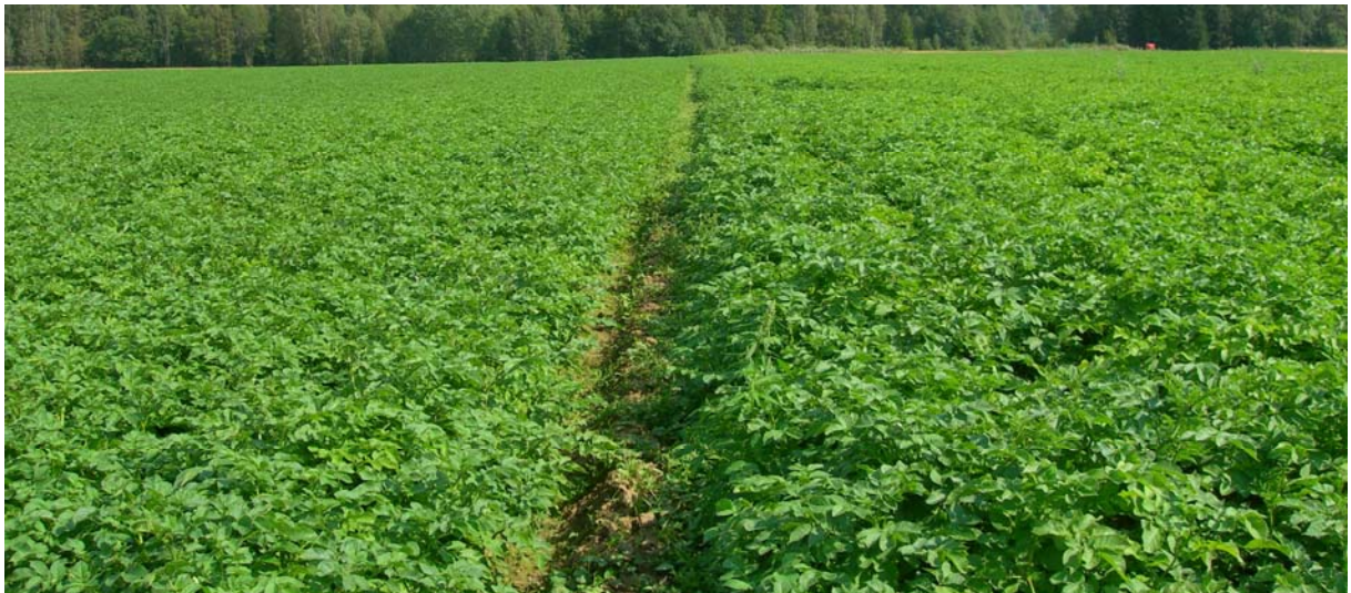
6. august (Uke 32) Beate: TRAD til venstre og FLEX til høyre i bildet. Frodigere vekst i FLEX.