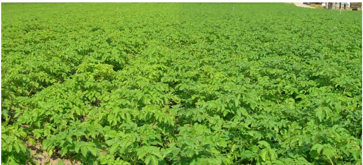
6. august (Uke 32) Asterix: FLEX til venstre og TRAD til høyre i bildet. Mørkere farge i TRAD.