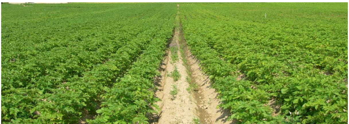
6. august (Uke 32) Redstar: TRAD til venstre og FLEX til høyre i bildet. Mørkere risfarge i TRAD.