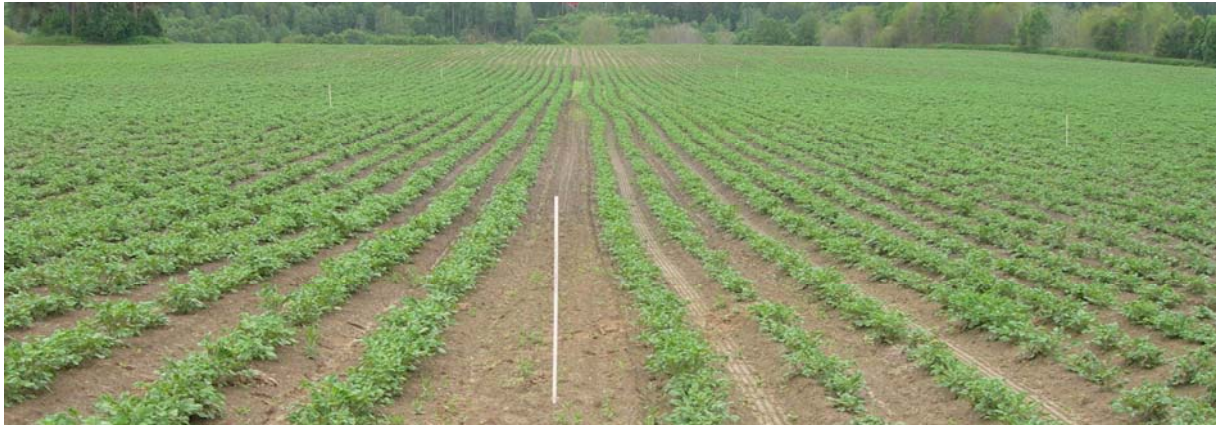
26. juni (Uke 26) Redstar: FLEX til venstre og TRAD til høyre for pinnen. Litt større og mørkere planter i FLEX.